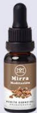
Mirra Aroma maderoso fresco, relajante y ayuda a la meditación # 90444