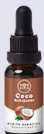
Coco Aroma tropical, relajante mental y relajante físico # 90109