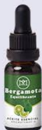
Bergamota Aroma frutal, equilibrador y tonificante # 90048