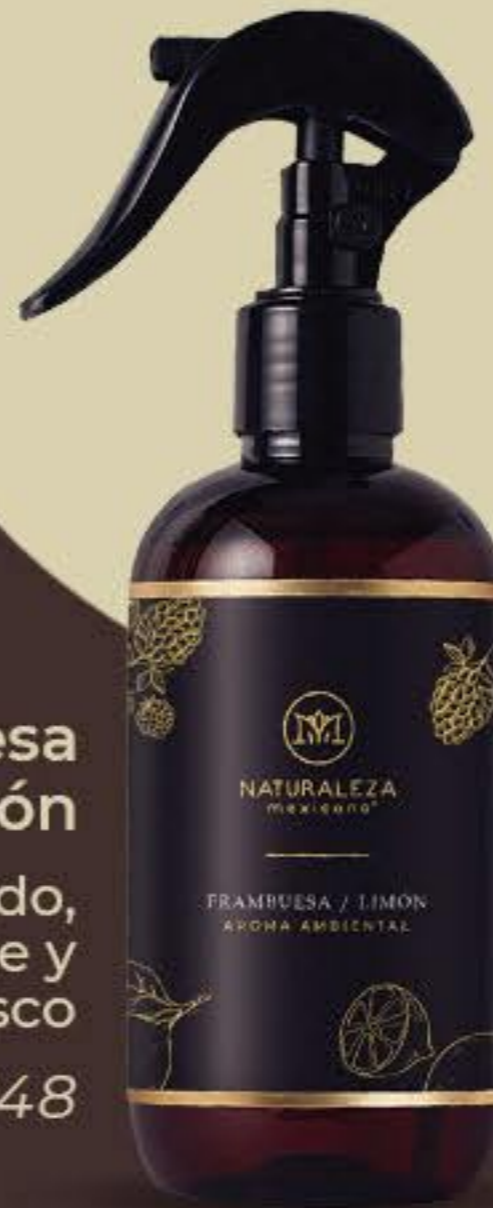
Frambuesa y Limón Afrutado, chispeante y muy fresco # 91748