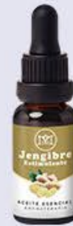
Jengibre Aroma cálido poco picante, estimulante y energizante # 90185