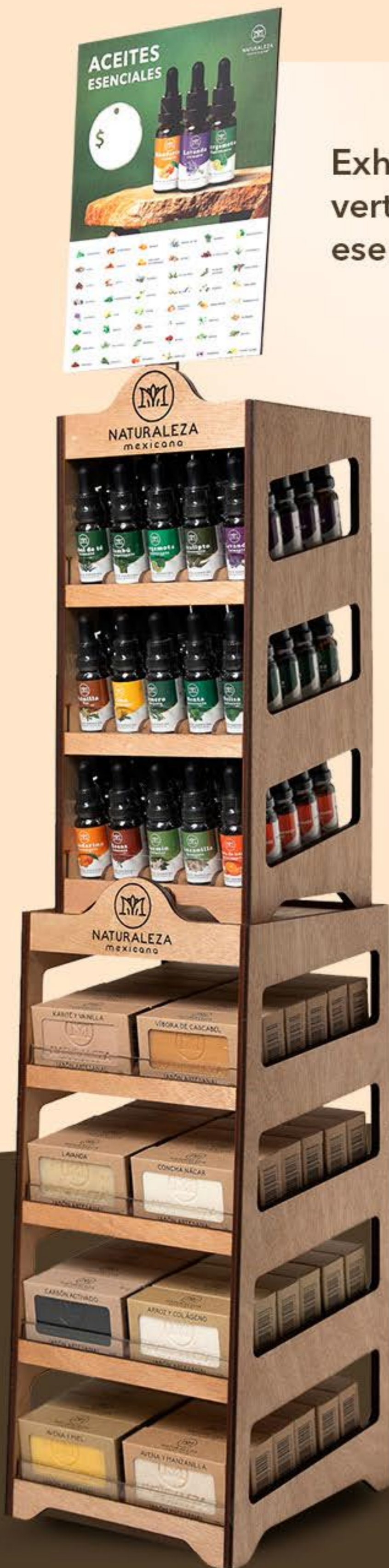
Exhibidor 8 jabones vertical + 15 aceites esenciales