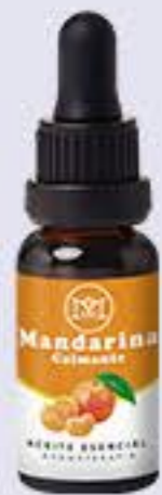
Mandarina Aroma cítrico y calmante # 90239