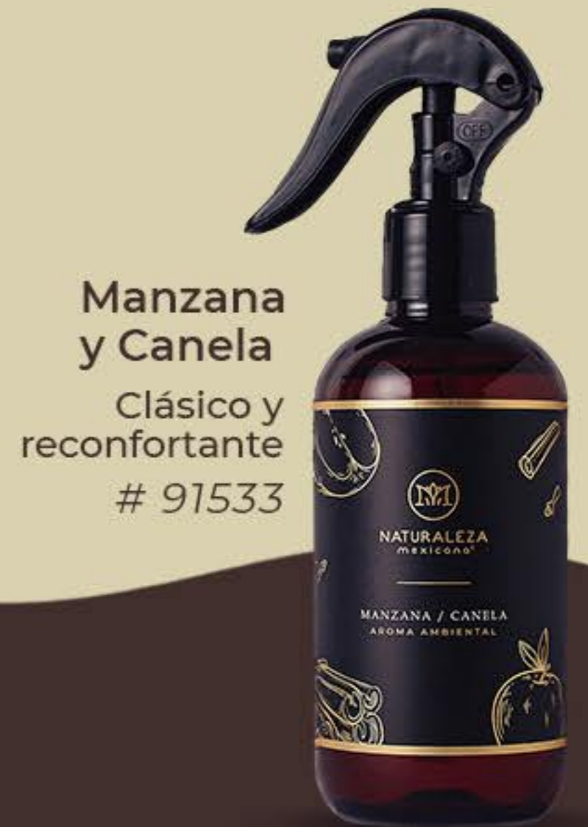
Manzana y Canela Clásico y reconfortante # 91533