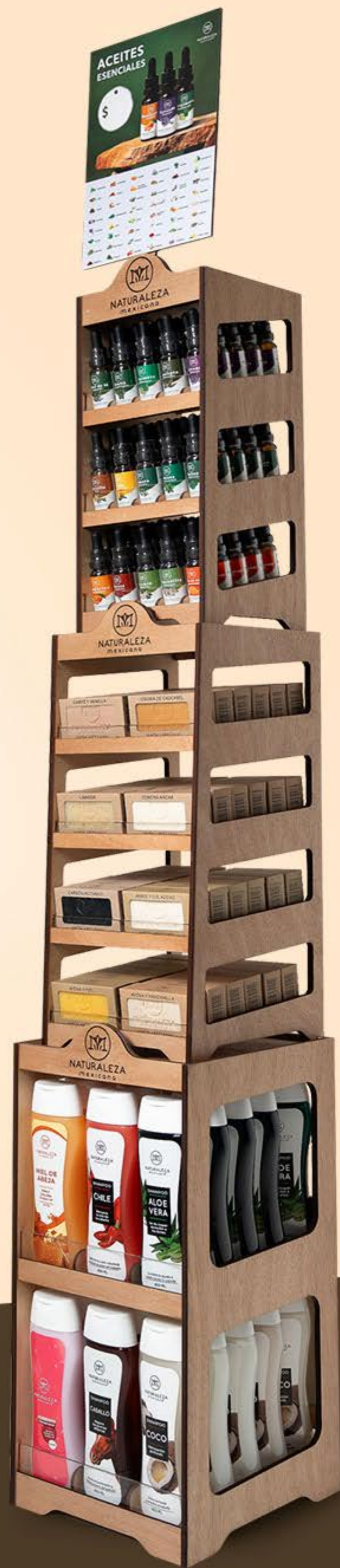
Exhibidor 6 shampoos + 8 jabones vertical + 15 aceites esenciales