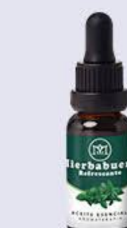
Hierbabuena Aroma fresco, excelente para abrir poros y tonificar la piel # 90154