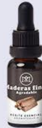
Maderas Finas Aroma maderoso y agradable # 90222