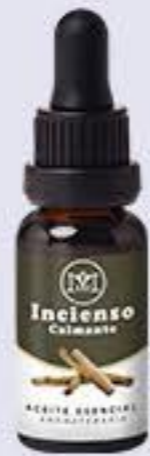
Incienso Aroma madera picante, ligeramente afrutados, calmante y relajante # 90161