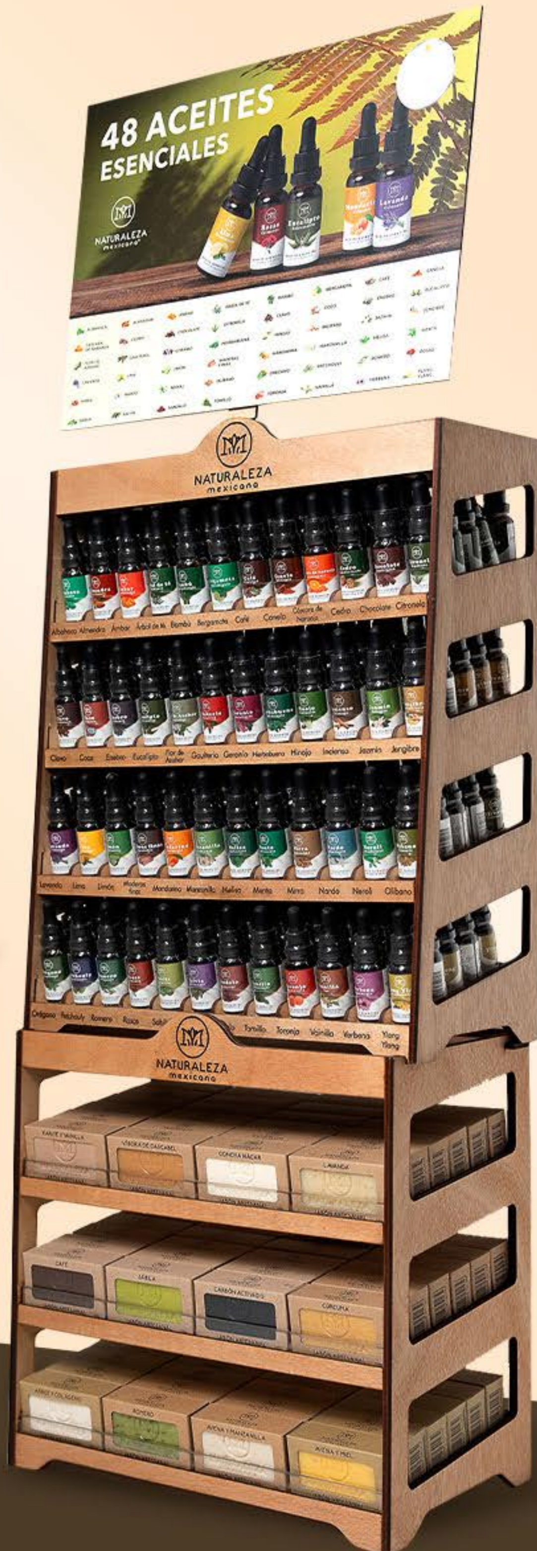
Exhibidor 12 jabones horizontal + Exhibidor 48 aceites esenciales