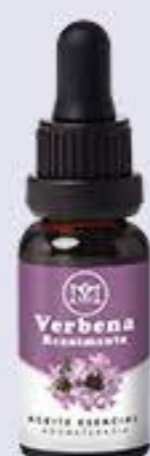
Verbena Aroma reanimante, energizante y refrescante # 90475