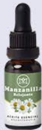
Manzanilla Aroma fresco y relajante # 90246