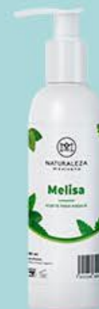
Melisa # 90888