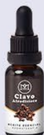
Clavo Aroma afrodisíaco y estimulante # 90413