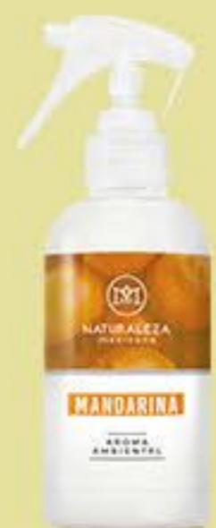
Mandarina # 90628