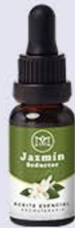
Jazmín Aroma afrodisiaco y seductor # 90178