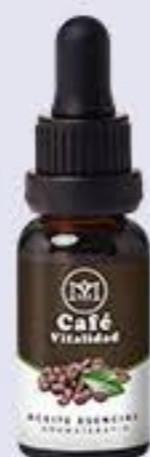
Café Aporta vitalidad y ayuda a la fatiga física # 90055