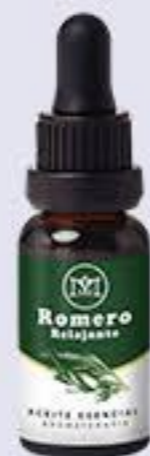
Romero Aroma fresco y relajante # 90307