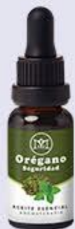
Orégano Aroma cálido y terroso. Ayuda a tener una piel saludable y brillante # 90437