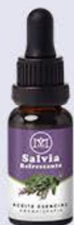
Salvia Aroma fresco, calma la ansiedad y depresión # 90338