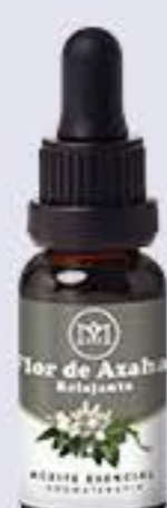
Flor de Azahar Aroma dulce, suavizante e hidratante. # 90130