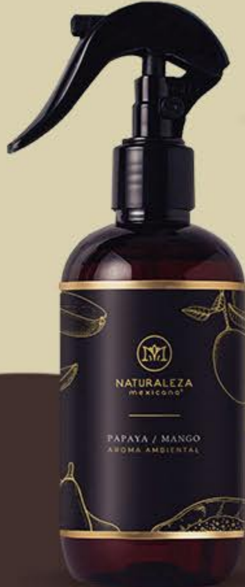
Papaya y Mango Tropical y vibrante # 91755