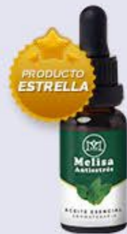
Melisa Aroma fresco, calmante y refrescante # 90253