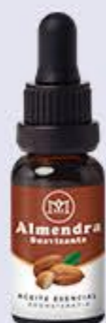
Almendra Aroma dulce, suavizante e hidratante. # 90000