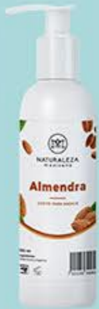
Almendra # 90857