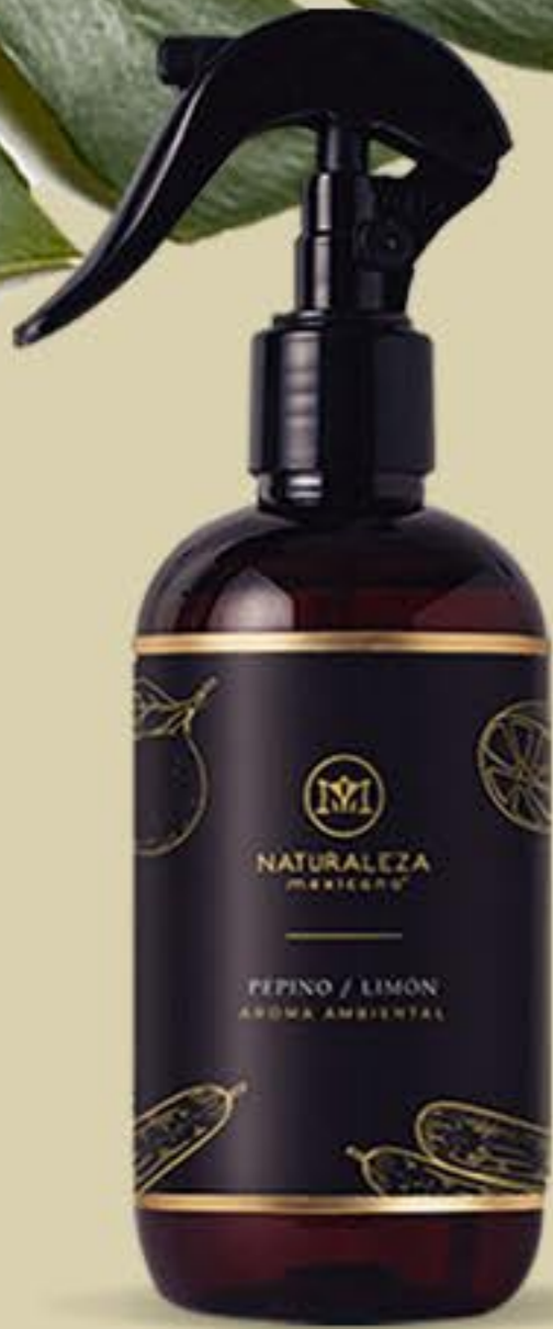
Pepino y Limón Fresco y revitalizante # 91731