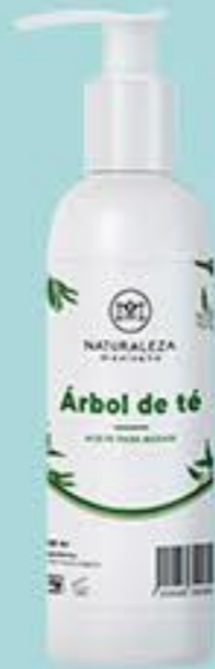
Árbol de té # 90802