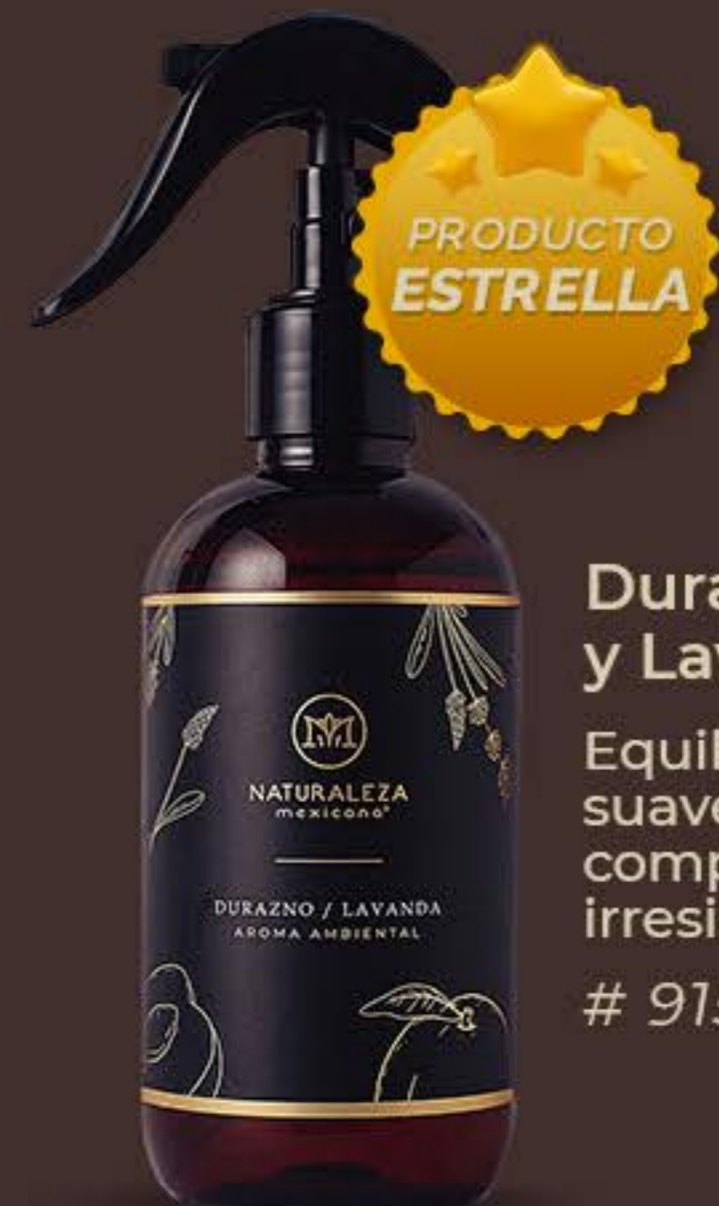
Durazno y Lavanda Equilibrante, suave y completamente irresistible # 91519