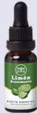
Limón Aroma frutal-cítrico y energizante # 90215