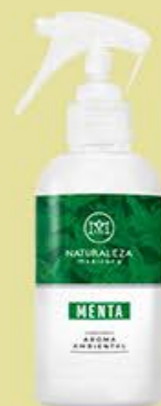
Menta # 90529