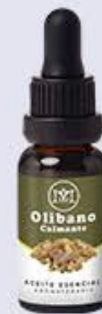
Olibano Aroma floral fresco y calmante # 90284