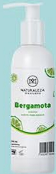
Bergamota # 90789