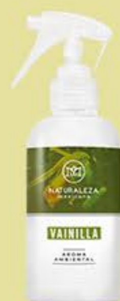
Vainilla # 91236