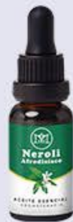
Neroli Aroma floral agri dulce, tranquilizante # 90277