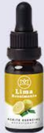
Lima Aroma cítrico-fresco, estimulante y refrescante # 90208