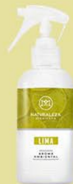
Lima # 91212