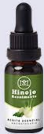
Hinojo Aroma floral y ligeramente picante. Tonificante e hidratante # 90390