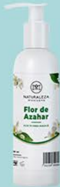
Flor de Azahar # 90895