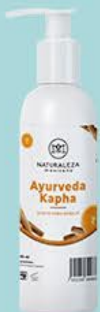
Ayurveda Kapha # 90833