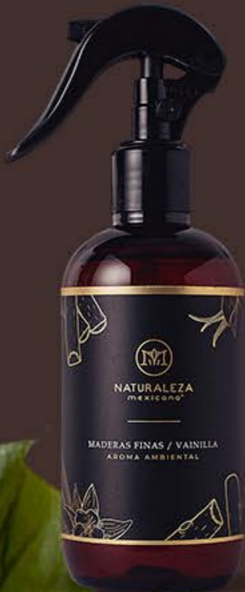
Maderas Finas y Vainilla Elegante y envolvente # 91557