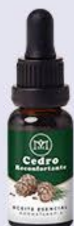
Cedro Aroma relajante, reconforta y mejora la autotestima # 90420