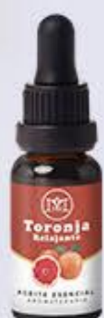
Toronja Aroma cítrico, reduce el estrés y es relajante # 90369