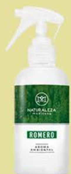
Romero # 90567