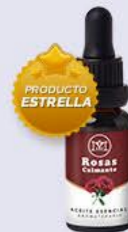
Rosas Aroma floral, calmante y estimulante # 90314