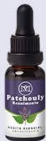
Patchouly Aroma maderoso seco, relajante y equilibrante # 90291