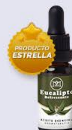
Eucalipto Aroma refrescante, despeja la mente y estimula los sentidos # 90123