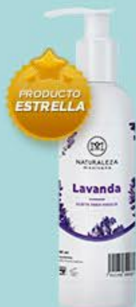
Lavanda # 90871