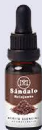
Sándalo Aroma maderoso floral, hidratante y relajante # 90345