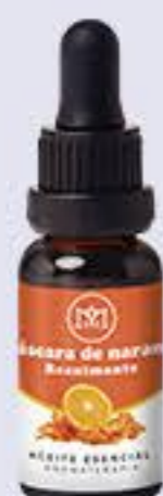
Cáscara de Naranja Aroma cítrico, reduce la ansiedad y es calmante # 90079