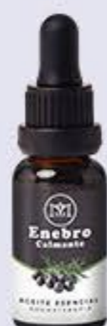
Enebro Aroma refrescante # 90116