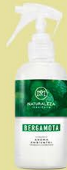
Bergamota # 90543