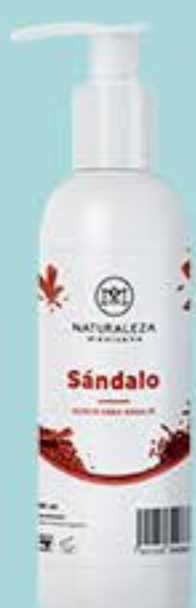
Sándalo # 90864