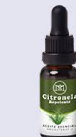
Citronela Aroma fresco, bueno para repeler mosquitos # 90093