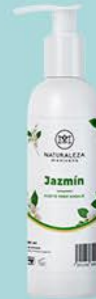
Jazmín # 90840