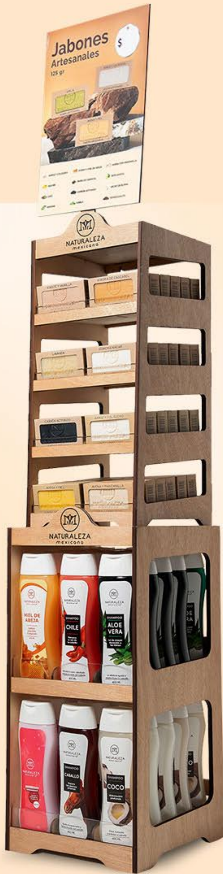
Exhibidor 6 shampoos + 8 jabones vertical