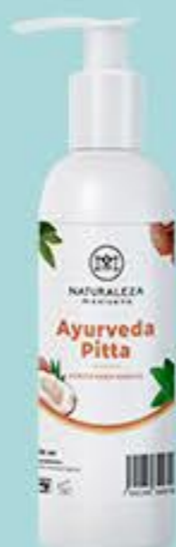
Ayurveda pitta # 90796