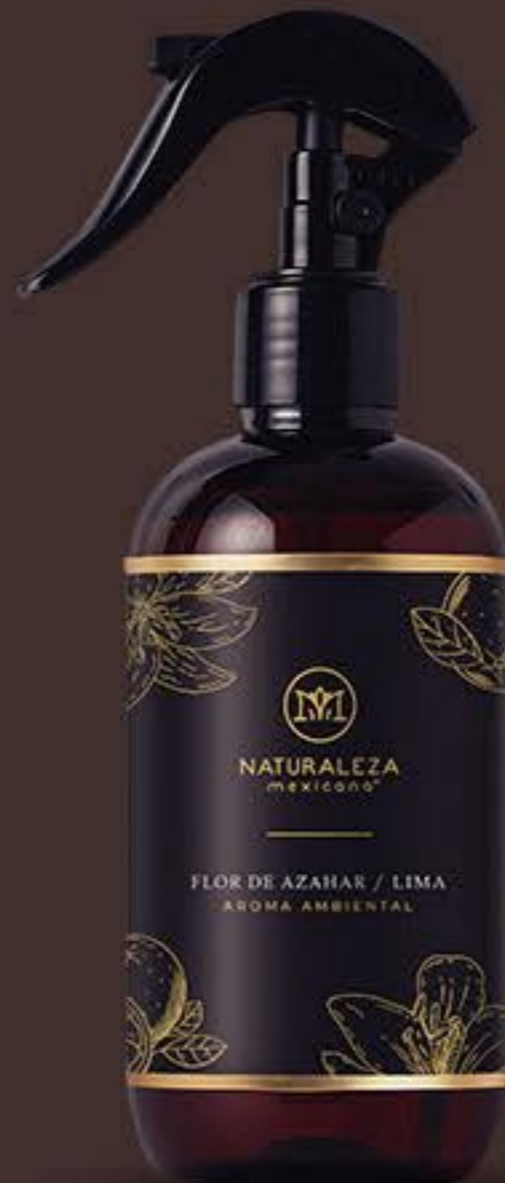
Flor de azahar y Lima Delicado y refrescante # 91762