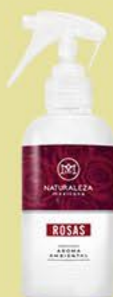
Rosas # 90598