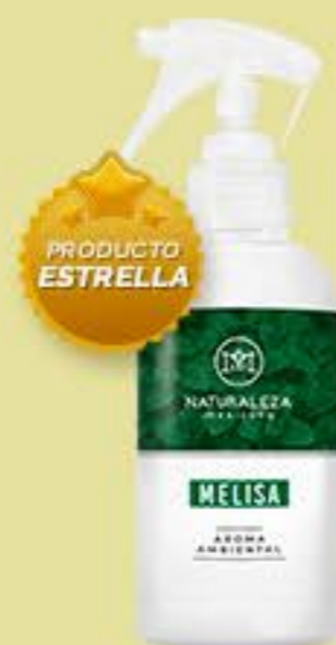
Melisa # 90512