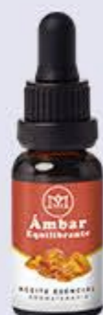
Ámbar Aroma afrodisíaco, antiestrés y equilibrante # 90017