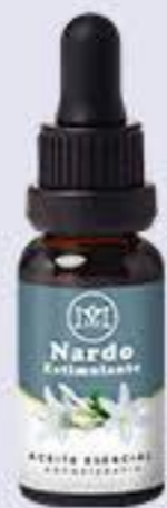
Nardo Aroma estimulante y relajante # 90451