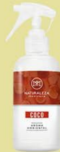
Coco # 91205