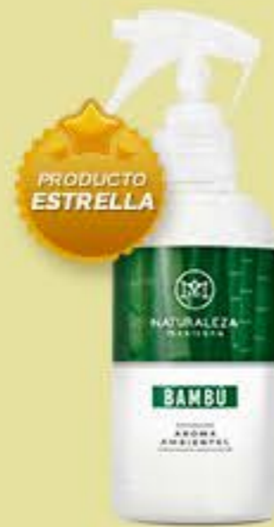
Bambú # 90550