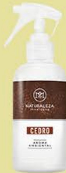
Cedro # 91199