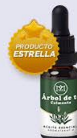
Árbol de té Aroma fresco, hidratante y calmante # 90024