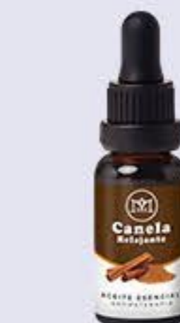
Canela Aroma afrodisíaco, calmante y relajante # 90062