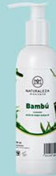
Bambú # 90901