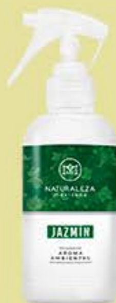
Jazmín # 90604