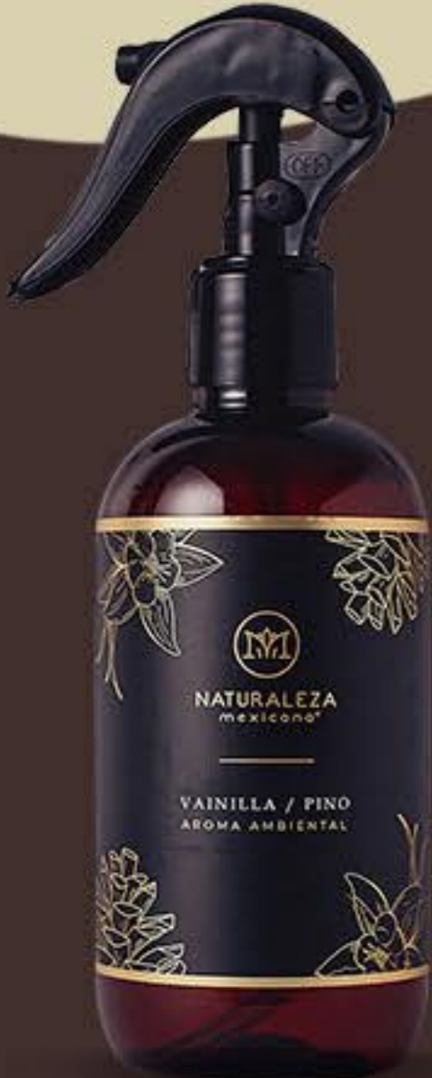
Vainilla y Pino Contraste perfecto entre lo dulce y lo natural # 91526