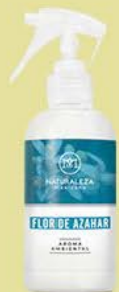
Flor de Azahar # 90536