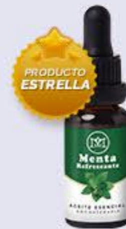
Menta Aroma mentolado y refrescante # 90260