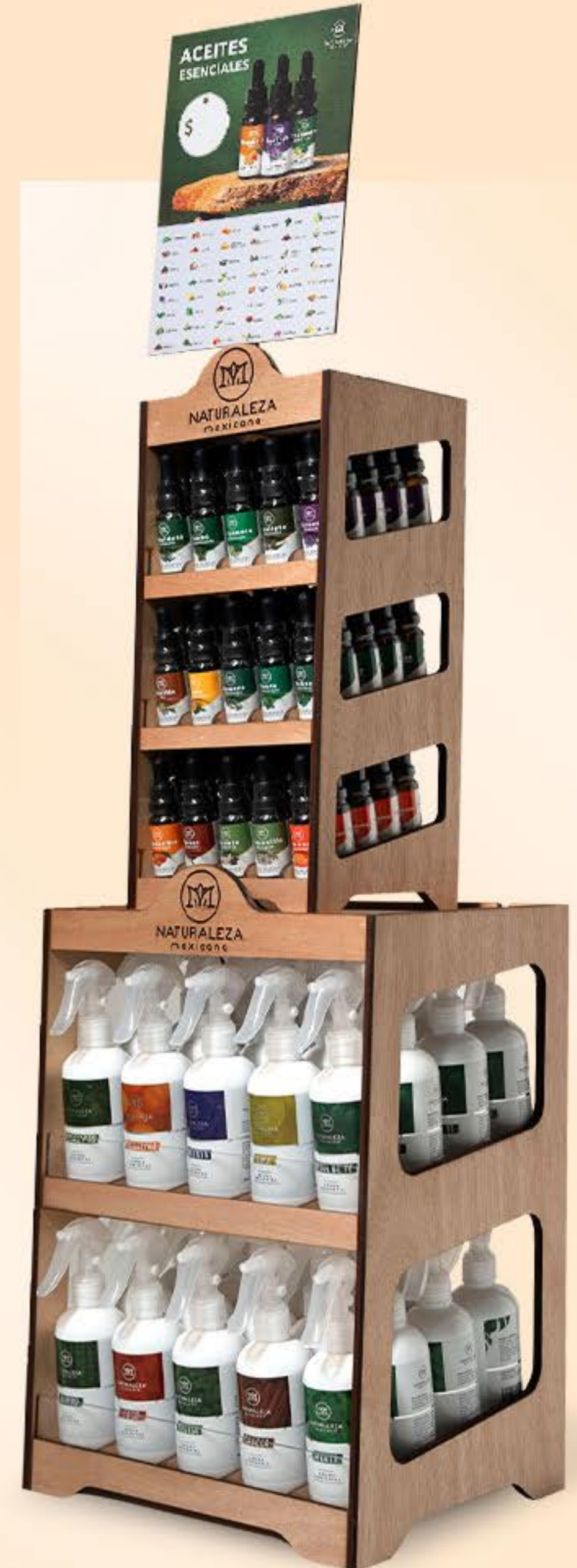
Exhibidor 10 aromas ambientales + 15 aceites esenciales