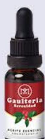
Gaulteria Aroma dulce mentolado y relajante # 90468