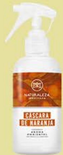
Cáscara de Naranja # 90611