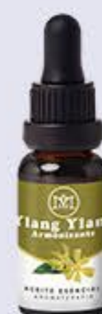
Ylang Ylang Aroma floral, cálido y fuerte. Armonizador # 90383