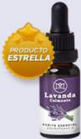
Lavanda Aroma floral fresco y calmante # 90192