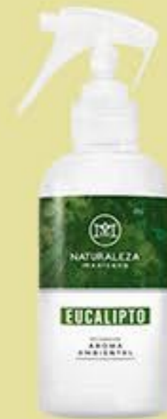
Eucalipto # 90505