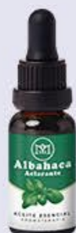
Albahaca Aroma refrescante y potente. Ayuda a aclarar la mente y fortalece la autoconfianza # 90406