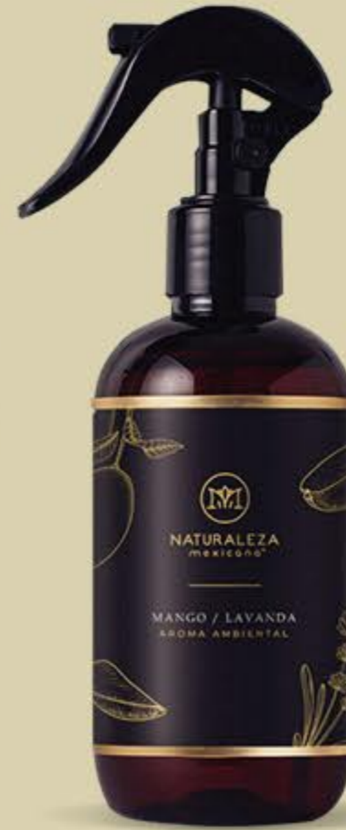
Mango y Lavanda Una combinación inesperada y adictiva # 91724