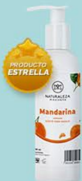
Mandarina # 90819