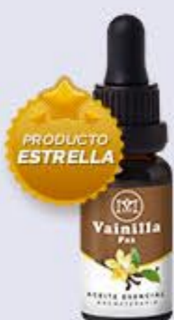
Vainilla Aroma caramelizado, calmante y aporta paz interior # 90376