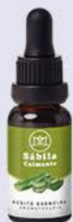
Sábila Aroma cítrico # 90321