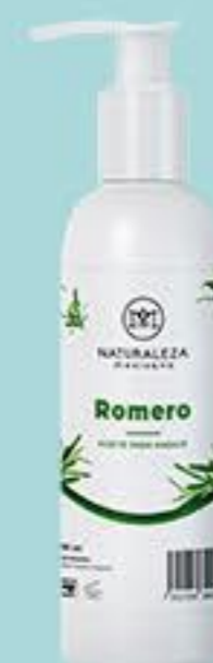
Romero # 90826