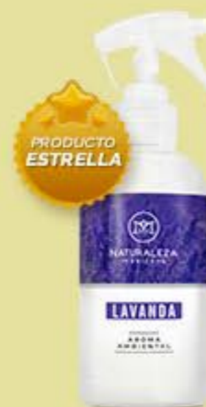
Lavanda # 90482