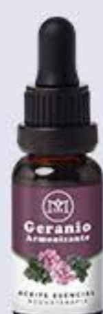
Geranio Aroma frutal dulce, armonizante, paz y serenidad # 90147