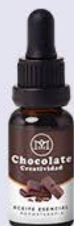
Chocolate Aroma místico, reduce la ansiedad y aumenta la creatividad # 90086