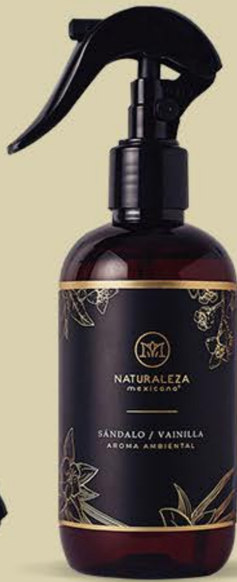
Sándalo y Vainilla Cálido, profundo y sofisticado # 91540