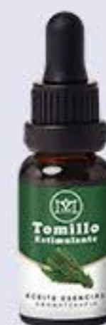
Tomillo Aroma especiado y afrodisiaco # 90352