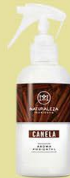
Canela # 90574