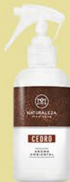
Cedro # 91199