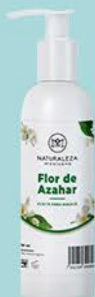
Flor de Azahar # 90895