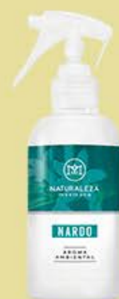
Nardo # 91229