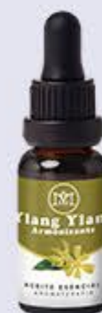
Ylang Ylang Aroma floral, cálido y fuerte. Armonizador # 90383