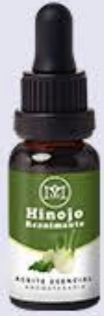
Hinojo Aroma floral y ligeramente picante. Tonificante e hidratante # 90390