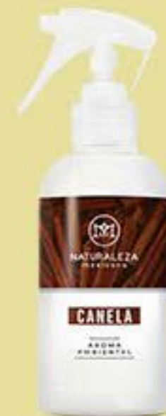
Canela # 90574