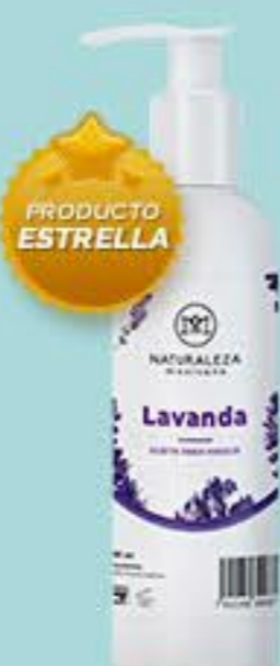
Lavanda # 90871