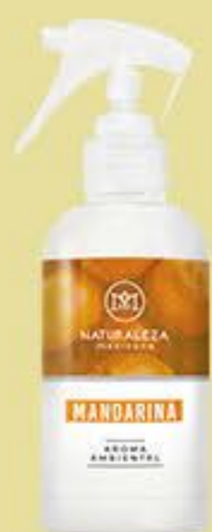
Mandarina # 90628