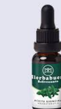
Hierbabuena Aroma fresco, excelente para abrir poros y tonificar la piel # 90154