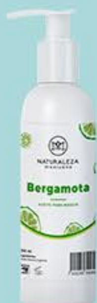
Bergamota # 90789