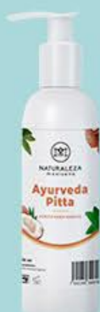
Ayurveda pitta # 90796