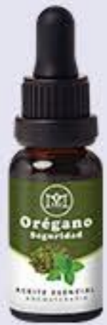
Orégano Aroma cálido y terroso. Ayuda a tener una piel saludable y brillante # 90437