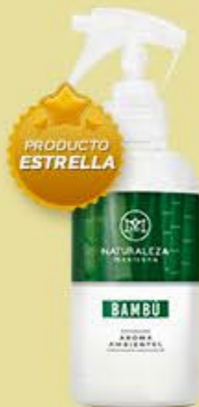
Bambú # 90550