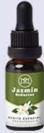
Jazmín Aroma afrodisiaco y seductor # 90178