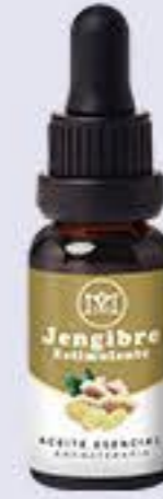
Jengibre Aroma cálido poco picante, estimulante y energizante # 90185