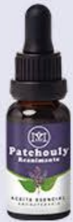
Patchouly Aroma maderoso seco, relajante y equilibrante # 90291