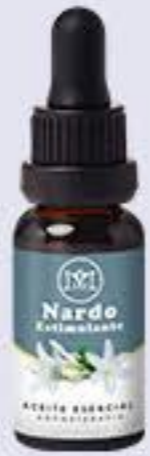
Nardo Aroma estimulante y relajante # 90451