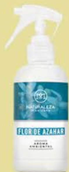
Flor de Azahar # 90536