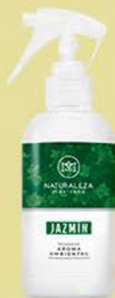
Jazmín # 90604