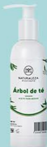
Árbol de té # 90802