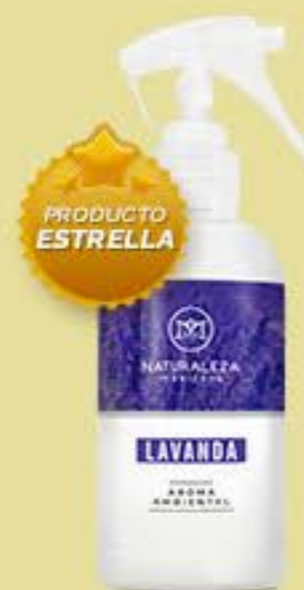
Lavanda # 90482