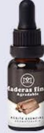
Maderas Finas Aroma maderoso y agradable # 90222