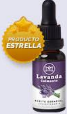
Lavanda Aroma floral fresco y calmante # 90192