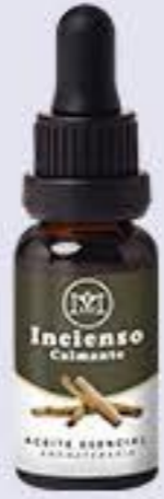
Incienso Aroma madera picante, ligeramente afrutados, calmante y relajante # 90161