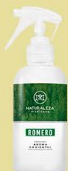
Romero # 90567