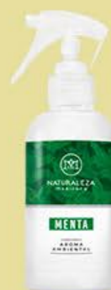
Menta # 90529