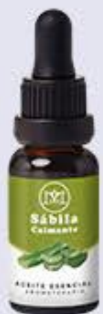
Sábila Aroma cítrico # 90321