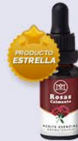
Rosas Aroma floral, calmante y estimulante # 90314