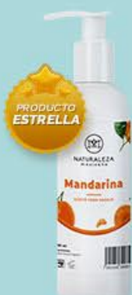
Mandarina # 90819