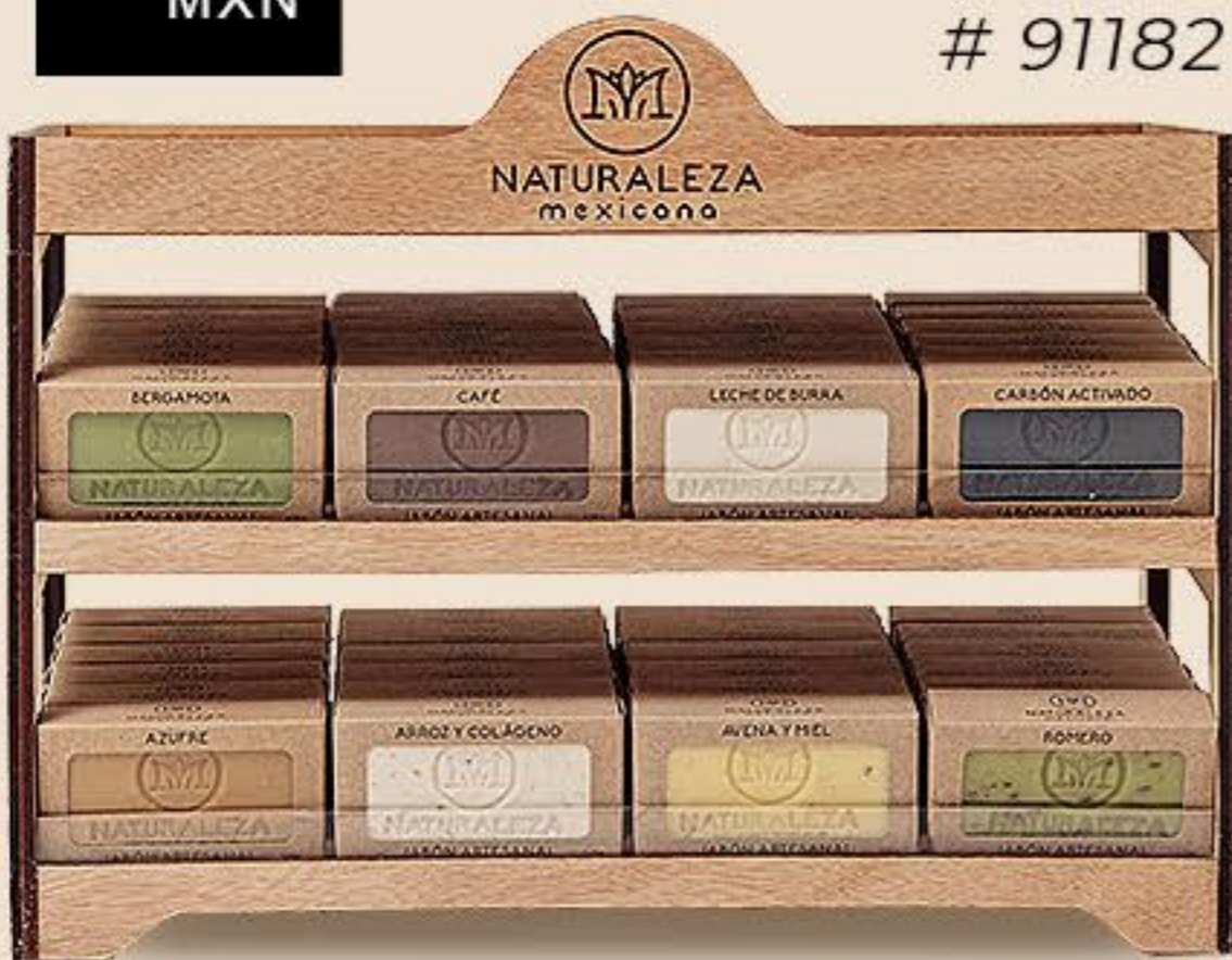
Exhibidor 8 Jabones Horizontal 1PZA # 91182