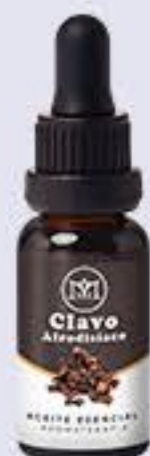
Clavo Aroma afrodisíaco y estimulante # 90413