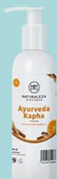
Ayurveda Kapha # 90833