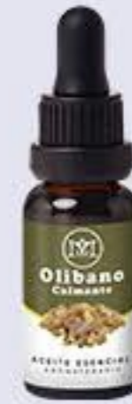
Olibano Aroma floral fresco y calmante # 90284