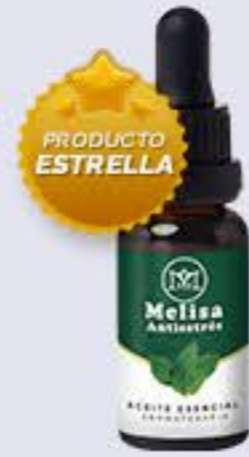
Melisa Aroma fresco, calmante y refrescante # 90253