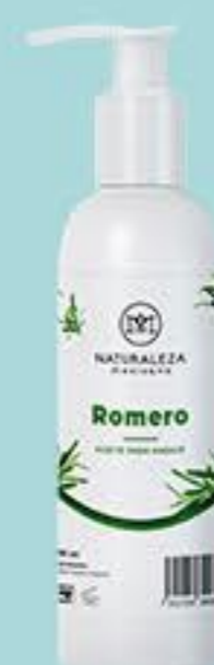
Romero # 90826