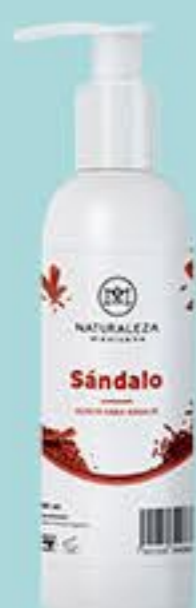
Sándalo # 90864