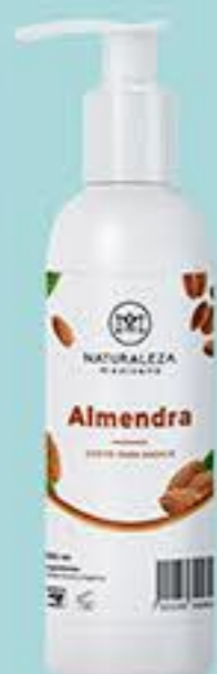
Almendra # 90857