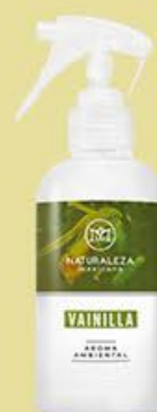
Vainilla # 91236