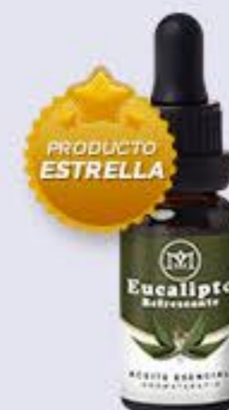
Eucalipto Aroma refrescante, despeja la mente y estimula los sentidos # 90123