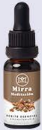
Mirra Aroma maderoso fresco, relajante y ayuda a la meditación # 90444