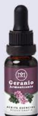
Geranio Aroma frutal dulce, armonizante, paz y serenidad # 90147