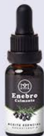
Enebro Aroma refrescante # 90116