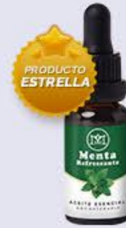
Menta Aroma mentolado y refrescante # 90260