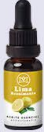
Lima Aroma cítrico-fresco, estimulante y refrescante # 90208