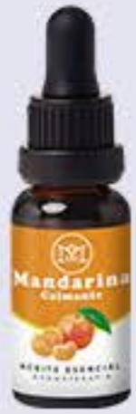
Mandarina Aroma cítrico y calmante # 90239