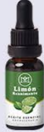
Limón Aroma frutal-cítrico y energizante # 90215