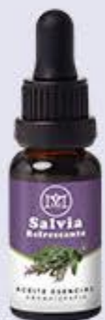
Salvia Aroma fresco, calma la ansiedad y depresión # 90338