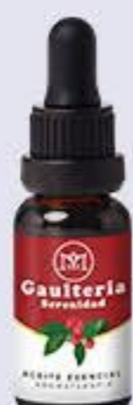
Gaulteria Aroma dulce mentolado y relajante # 90468