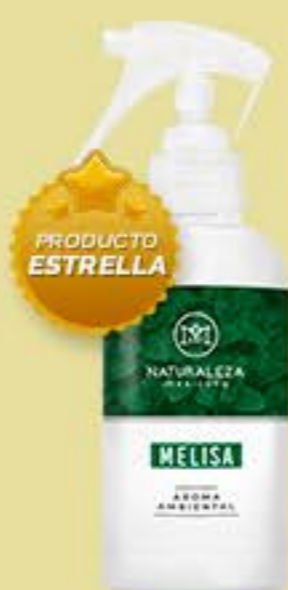
Melisa # 90512