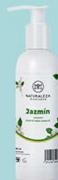
Jazmín # 90840