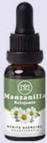
Manzanilla Aroma fresco y relajante # 90246