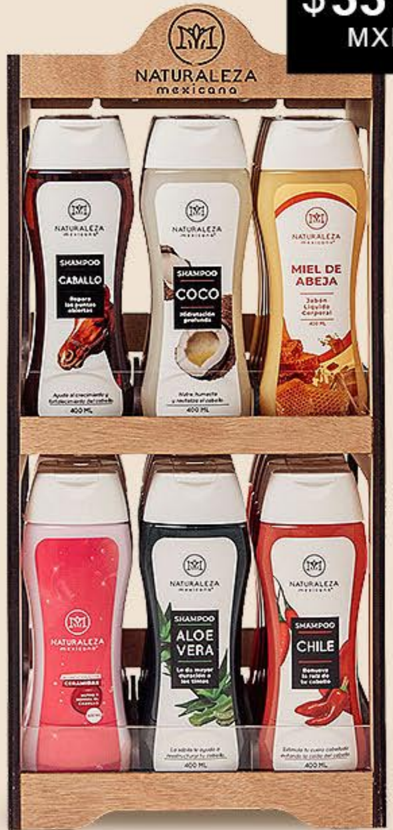
Exhibidor 6 Shampoos Vertical 1 PZA # 91113