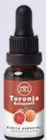
Toronja Aroma cítrico, reduce el estrés y es relajante # 90369