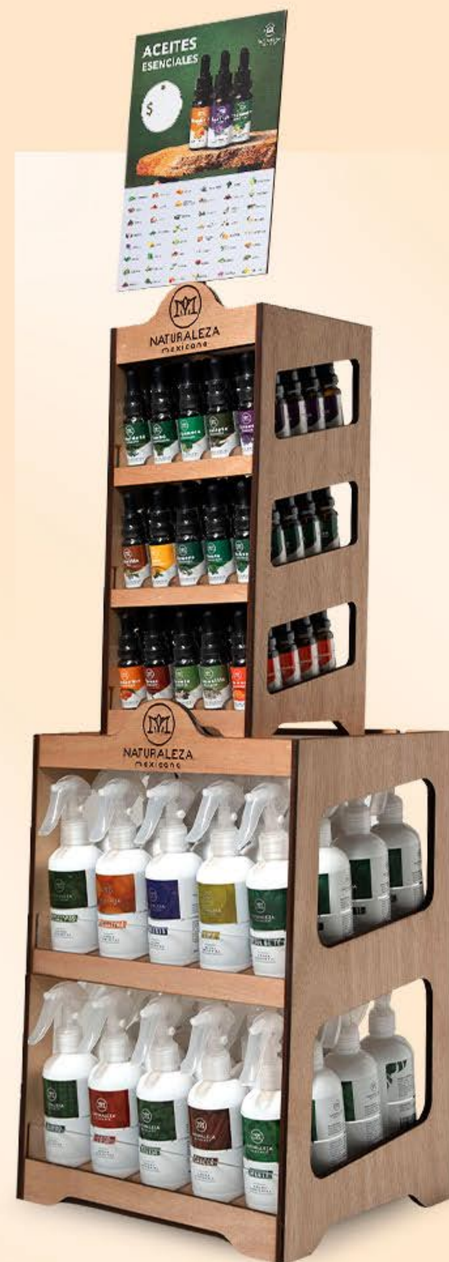
Exhibidor 10 aromas ambientales + 15 aceites esenciales