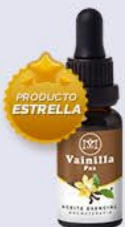
Vainilla Aroma caramelizado, calmante y aporta paz interior # 90376