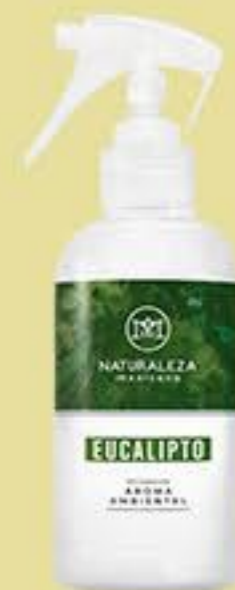
Eucalipto # 90505