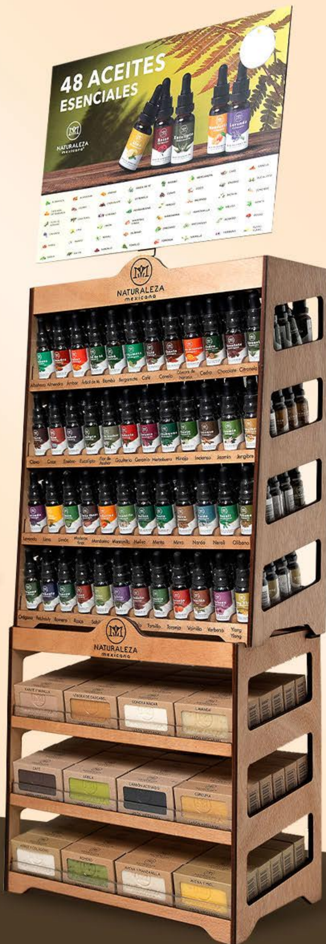
Exhibidor 12 jabones horizontal + Exhibidor 48 aceites esenciales