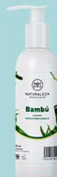
Bambú # 90901