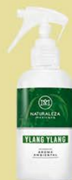
Ylang Ylang # 90581