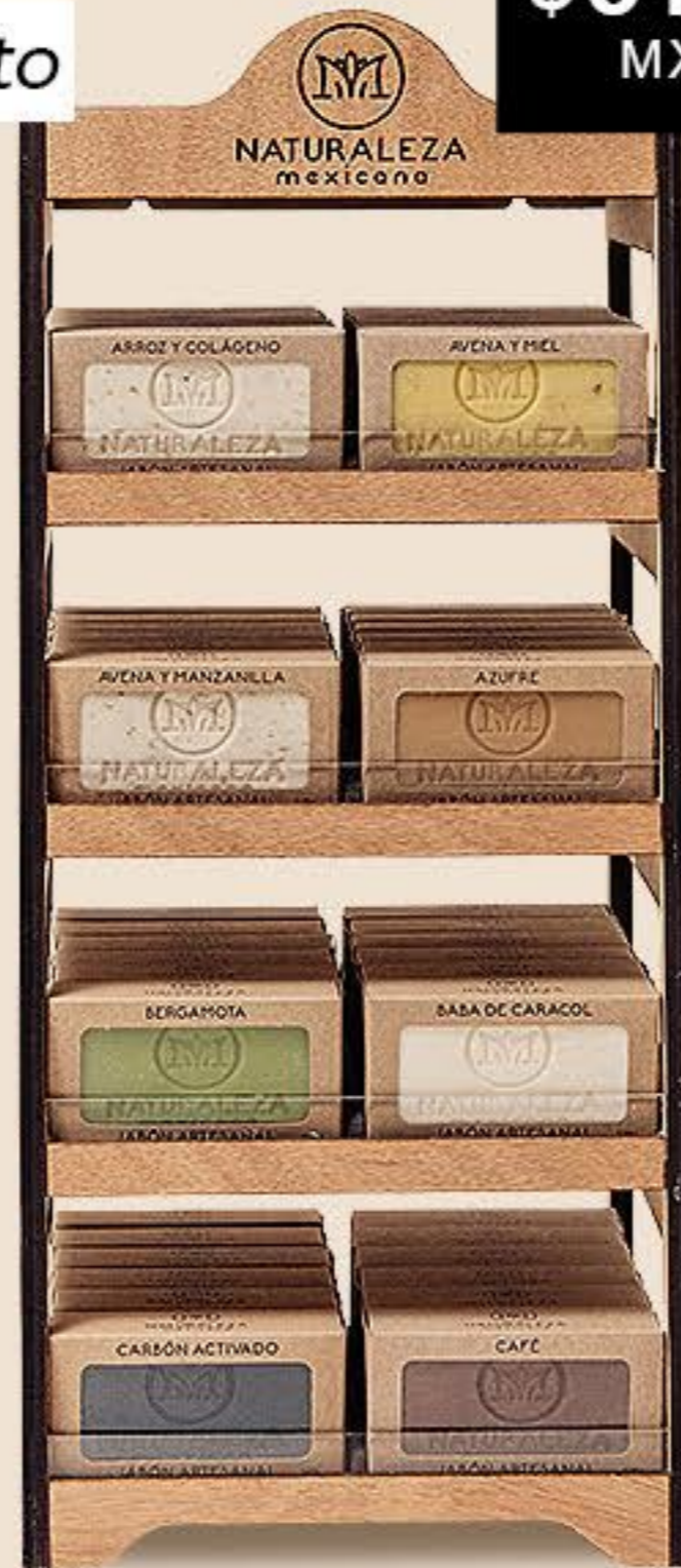
Exhibidor 8 Jabones Vertical 1PZA # 91175