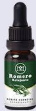
Romero Aroma fresco y relajante # 90307