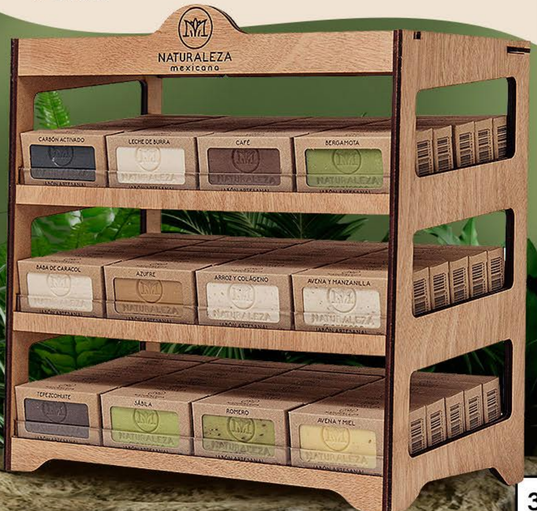
Exhibidor 12 Jabones Horizontal 1PZA # 91366