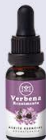
Verbena Aroma reanimante, energizante y refrescante # 90475